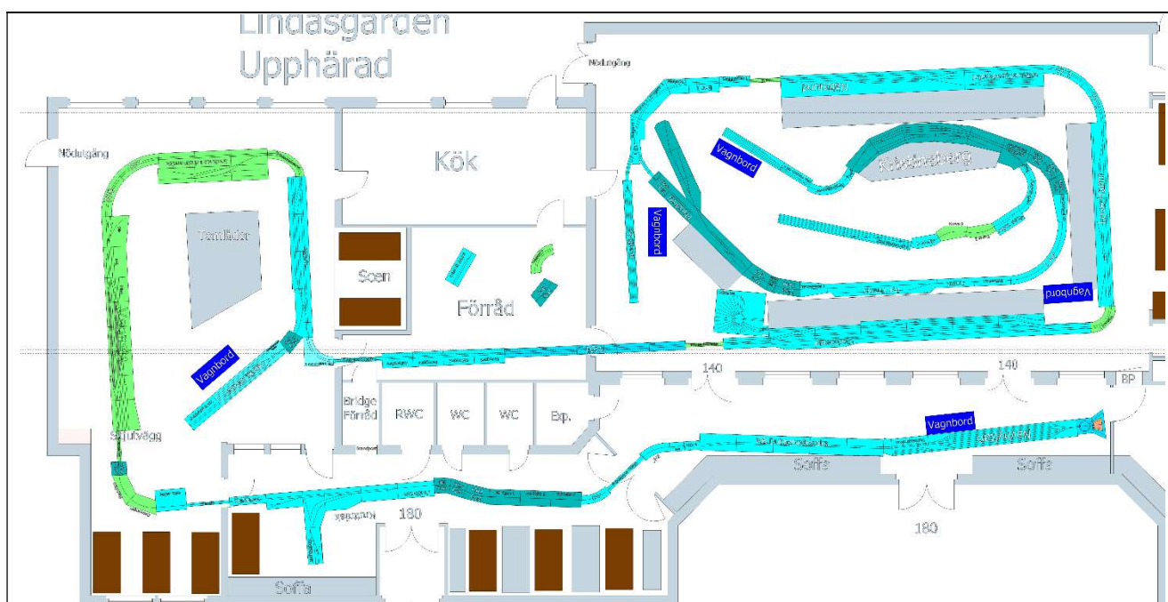
Fig. 3. Exempel på bana ritat i CAD.

Planeringen görs i någon form av CAD-verktyg, där både lokalens och modulernas mått läggs in. I dag finns ritningar på de flesta moduler redan i något CAD-system, men ofta behöver dessa ritningar kompletteras; för att CAD-ritning saknas helt eller för att ritning finns med inte i det format som CAD-verktyget kräver.