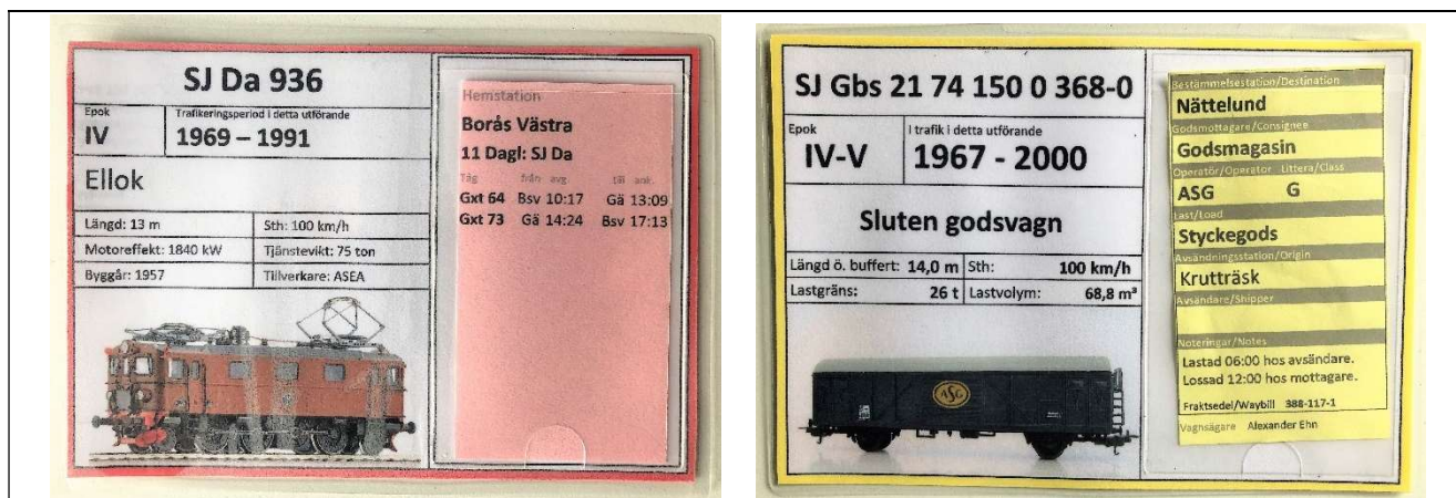
Fig. 2. Exempel på lok- och vagnkort för H0

Till lok- och vagnar som körs i trafikspel behöver det ofta finnas lok- resp. vagnkort. Kortet används för att identifiera rätt fordon och hålla omlopps- eller fraktsedel. Kortet följer fordonet under hela trafikspelet. Det är lokföraren som kontrollerar att korten motsvarar lok- och vagnar i tåget. Eventuella fel påpekas till den som ansvarar för stationen. Kan det inte lösas, får det rättas till innan nästa trafikspel startar.