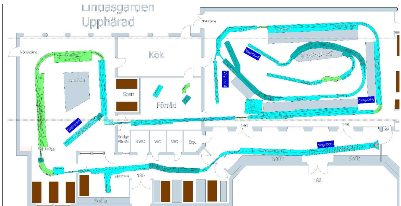
Fig. 1. Exempel på bana ritat i CAD.

Planeringen görs i någon form av CAD-verktyg, där både lokalens och modulernas mått läggs in. I dag finns ritningar på de flesta moduler redan i något CAD-system, men ofta behöver dessa ritningar kompletteras; för att CAD-ritning saknas helt eller för att ritning finns med inte i det format som CAD-verktyget kräver.