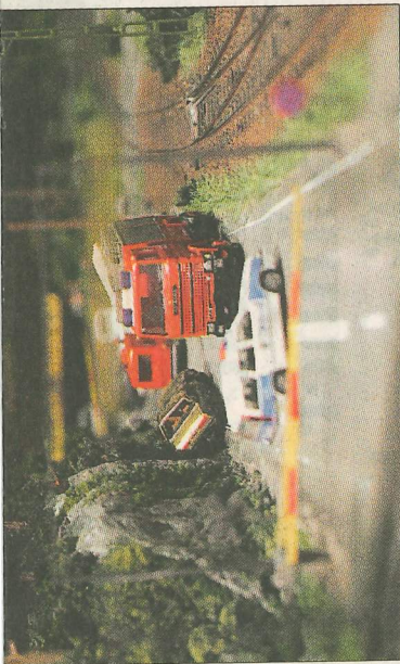
Det är inte bara tågen och rälsen som är viktiga när man bygger utan även landskapet och detaljerna runtom.