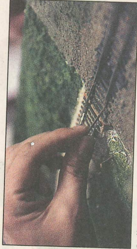
Rallare med små redskap.