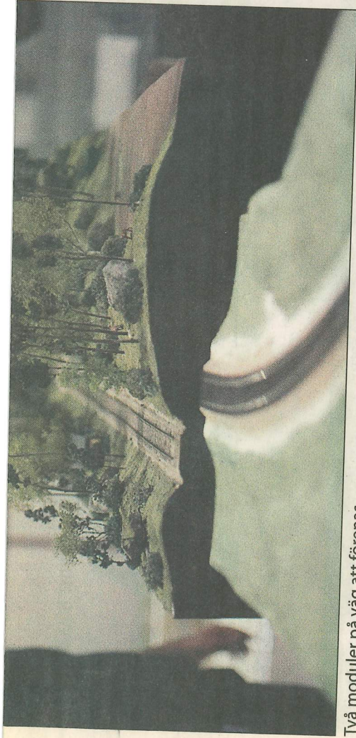
Två moduler på väg att förenas.