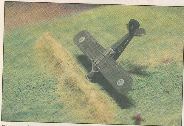
Ett nyss kraschlandat flygplan. Modellmakaren är flygledare på Arlanda.

REDAKTÖR Anders Wennberg • 026 15 96 03 anders.wennberg@gd.se