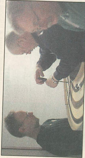
Mycket jobb är det.