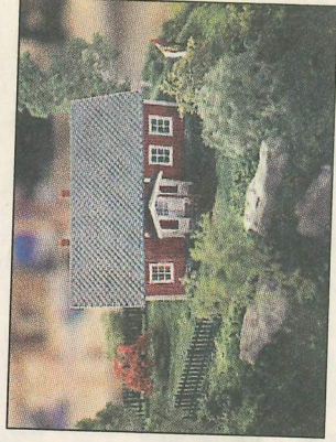
Ett hus med småländsk förebild.