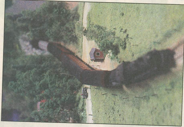
Tåg på ingång.